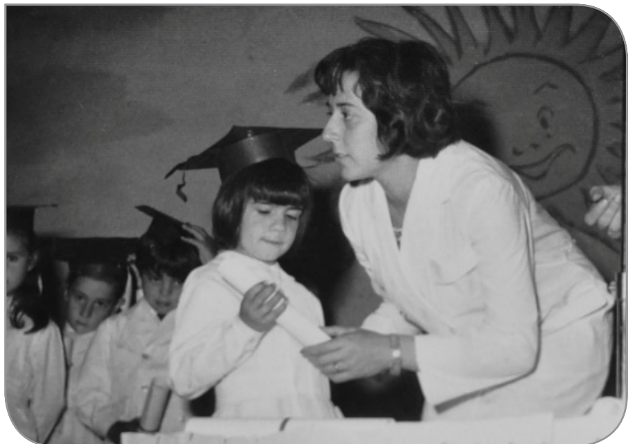
La escuela primaria.